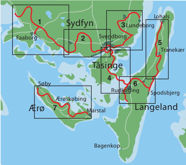
Übersichtskarte über das Wanderweg und die 7 Faltkarte.