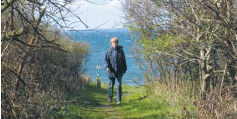
Unterwegs auf dem Wanderweg des Inselmeeres erwarten Sie schöne Aussichten

erscheinen Anfang September 2007 in Verbindung mit der Eröffnung dieser Strecken. Informieren Sie sich unter www.detsydynskeoehav.dk, wo Sie auch mehr über den Wanderweg des Inselmeeres erfahren können.