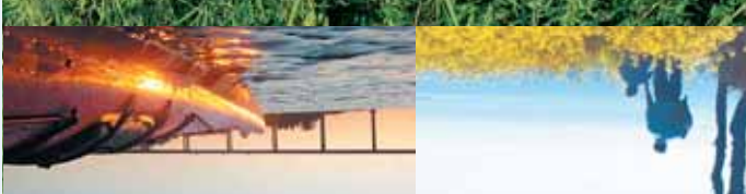
-Tage des grünen Werts

Der Tag des Inselmeeres ist ein grosses Naturevent für die ganze Familie mit einem umfassenden Angebot von verschiedenen Aktivitäten auf Land und zur See. Mehr Infos erhalten Sie unter www.oehavetsdag.dk oder aus einem im örtlichen Fremden-verkehrsureau erhältlichlen Programm.