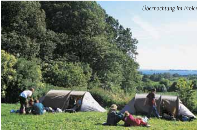
Übernachtung im Freien

Auf den Werdern gibt es keine Einrichtung für Gäste und deshalb bitten wir Sie, die auf der Karte markierten Übernach-tungsmöglichkeiten zu benutzen. Hier finden Sie Serviceein-richtungen und Sie stören die Natur nicht.