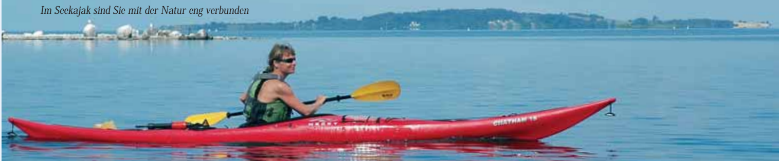
Im Seekajak sind Sie mit der Natur eng verbunden

Rund um Taasinge ist eine Fahrt mit abwechselnden Natur-eindrücken, wo man auf das Gewässer südlich von Taasinge mit seinen Scharen von ruhenden Vögeln aufmerksam sein muss. Kreuzen Sie nicht unter den Scharen herum, rudern Sie ruhig weiter. Bei ruhigem Wetter schaffen die meisten diese Fahrt ohne Probleme, aber man sollte auf die Stromverhältnisse in Svend-borgsund achten, die in der Fahrinne am stärksten sind. Die Fahrt kann einen Tag dauern, aber mit Vorteil über zwei Tage genossen werden.